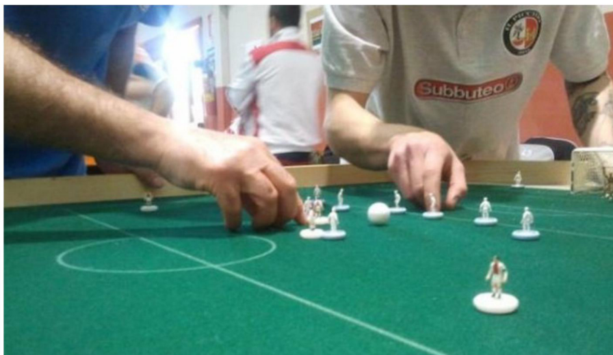
Una partita di subbuteo