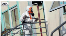
Rimozione Eternit - Affidati ai professionisti migliori. Richiedi 5 Preventivi Gratuiti.