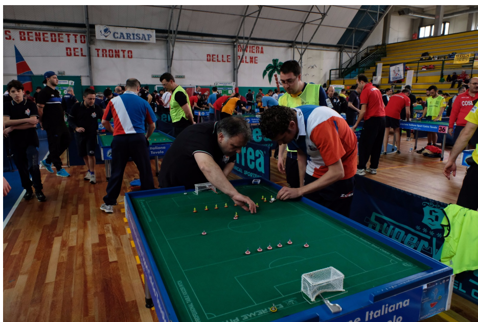
Al via "Major of Italy" a San Benedetto

A contendersi i trofei in palio per le categorie Team, Open, Veterani e Giovanili, saranno giocatori provenienti dalle principali fucine di talenti italiane e straniere e gli italiani, freschi vincitori dei trionfi della World Cup, giocata a Parigi a settembre