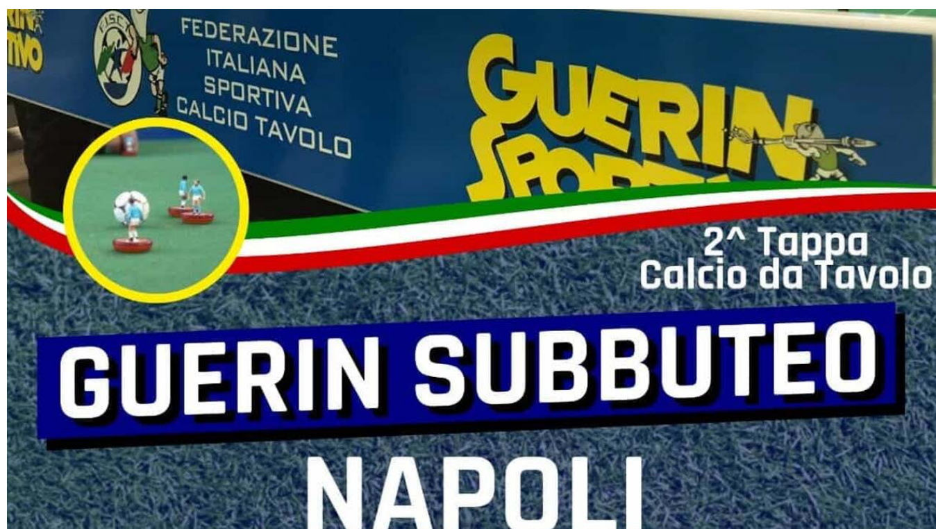
Guerin Subbuteo, la tappa di Napoli

La seconda tappa del torneo itinerante si terrà nel prossimo fine settimana nel capoluogo campano, presso il Polifunzionale di Soccavo