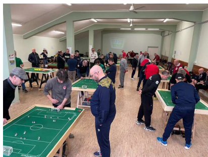
La sala sede del torneo